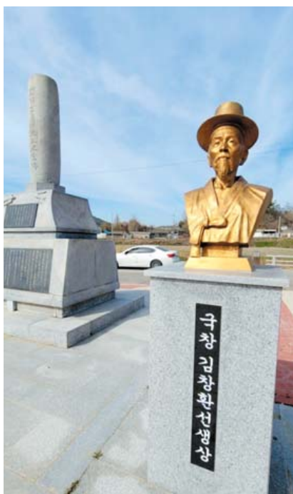
광산구 삼도동에 건립된 김창환 기념비.

창극은 소리꾼들이 배역을 맡아 창(唱)을 중심으로 극을 전개하면서 노래와 연기를 했다.