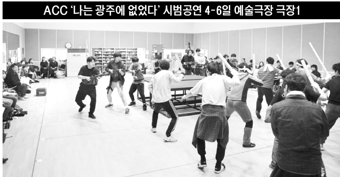
국립아시아문화전당(ACC)이 오는 4-6일 ACC 예술극장 극장1 무대에 5·18민주화운동을 배경으로 한 관객 참여형 공연 '나는 광주에 없었다'를 올린다. 사진은 '나는 광주에 없었다' 공연 연습 중인 배우들.

어린이들부터 30대까지, 현재의 광주를 사는 젊은이들에게 1980년 광주의 5·18은 역사 속 사건 중 하나일지도 모른다. 태어나기도 훨씬 전의 일이며, 직접 겪어보지 않은 일이기 때문이다. 체험극을 통해 광주의 5·18을 몸소 체험해볼 수 있는 자리가 마련된다.