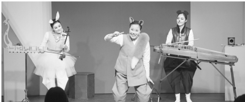
'숲속음악대 덩따쿵'의 어린이 공연 사진.

이 생일잔치에 초대받아 멋진 국악 연주를 들려주는 국악 체험극이다. 공연 진행 중 유아들이 국악기 해금, 가야금, 거문고, 아쟁 4개 악기를 직접 만져보고 연주자와 함께 연주도 해보는 체험과 국악장단 따라하기 등 다채로운 체험을 할 수 있다. 아이들에게 국악에 대한 흥미와 친숙함을 한 층 더 높여줄 예정이다. 또한 공연 종료 후 출연자와 함께 기념사진 촬영이 진행된다.