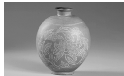
사진 위부터 김현승시초, 각추상석기와 나이프형석기, 분청사기상감모란문편병.

·철 도서들로 꾸며졌다. 또한 정독주 동문의 기증 유물 중 대다수를 차지하는 도자기(청자·분청사기·백자)를 발굴 유물인 질그릇과 연결, 그릇의 역사 코너로 전시함으로써 우리나라 도자기 역사를 이해하는 데 큰 도움이 될 것으로 보인다.