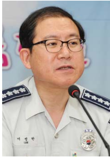
“4대약 근절을 위해 지속적으로 노력해 나갈 것이며 4대약 뿐만 아니라 범죄예방 등 민생치안에 있어서도 국민에게 공감받는 경찰이 되겠습니다.”