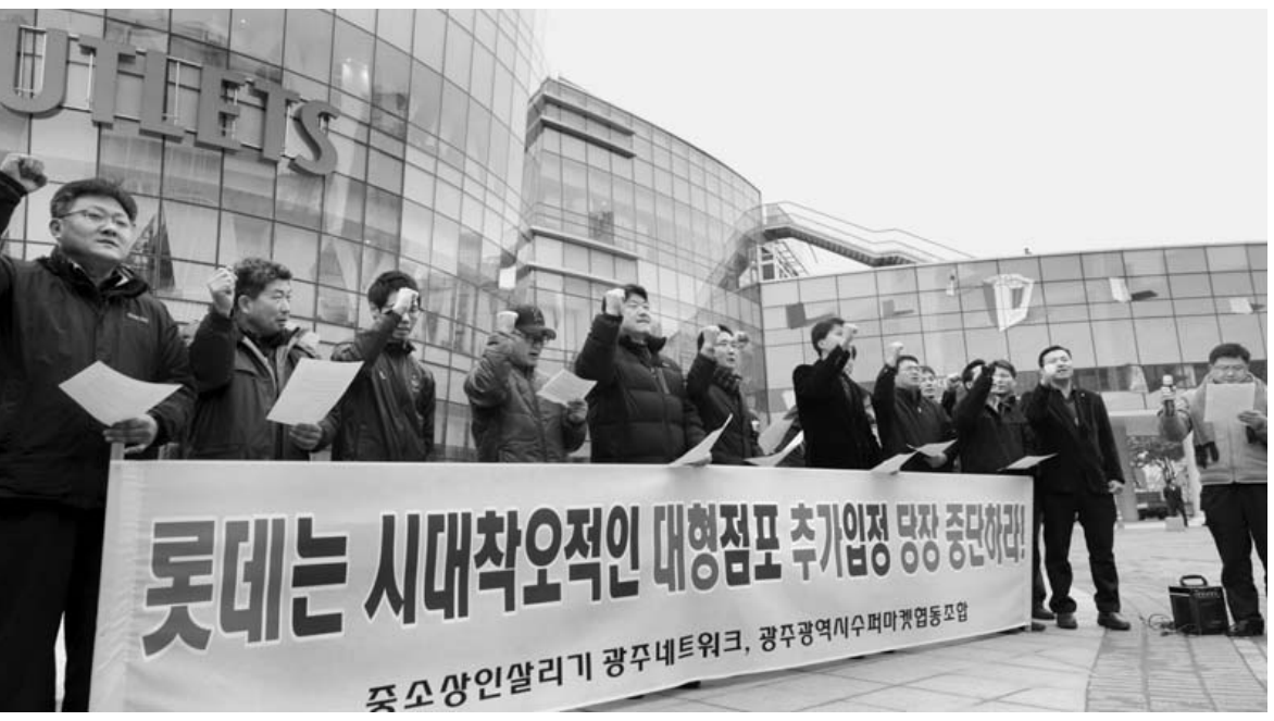
"중소상인 죽이는 무차별 입점 중단하라" 중소기업 살리기 광주네트워크와 광주슈퍼마켓협동조합 상인들이 6일 오전 광산구 롯데마트 수완점에서 기자회견을 갖고 북구 신용동의 창고형 할인매장 입점추진 중단을 촉구하고 있다.

한편, 광주에서는 지난해 북구 매곡동 이마트 입점 추진 중 우회 입점 논란, 건축허가·취소 등 갈등으로 현재까지 소송이 진행 중이다. /정다운 기자 swiss@kjdaily.com